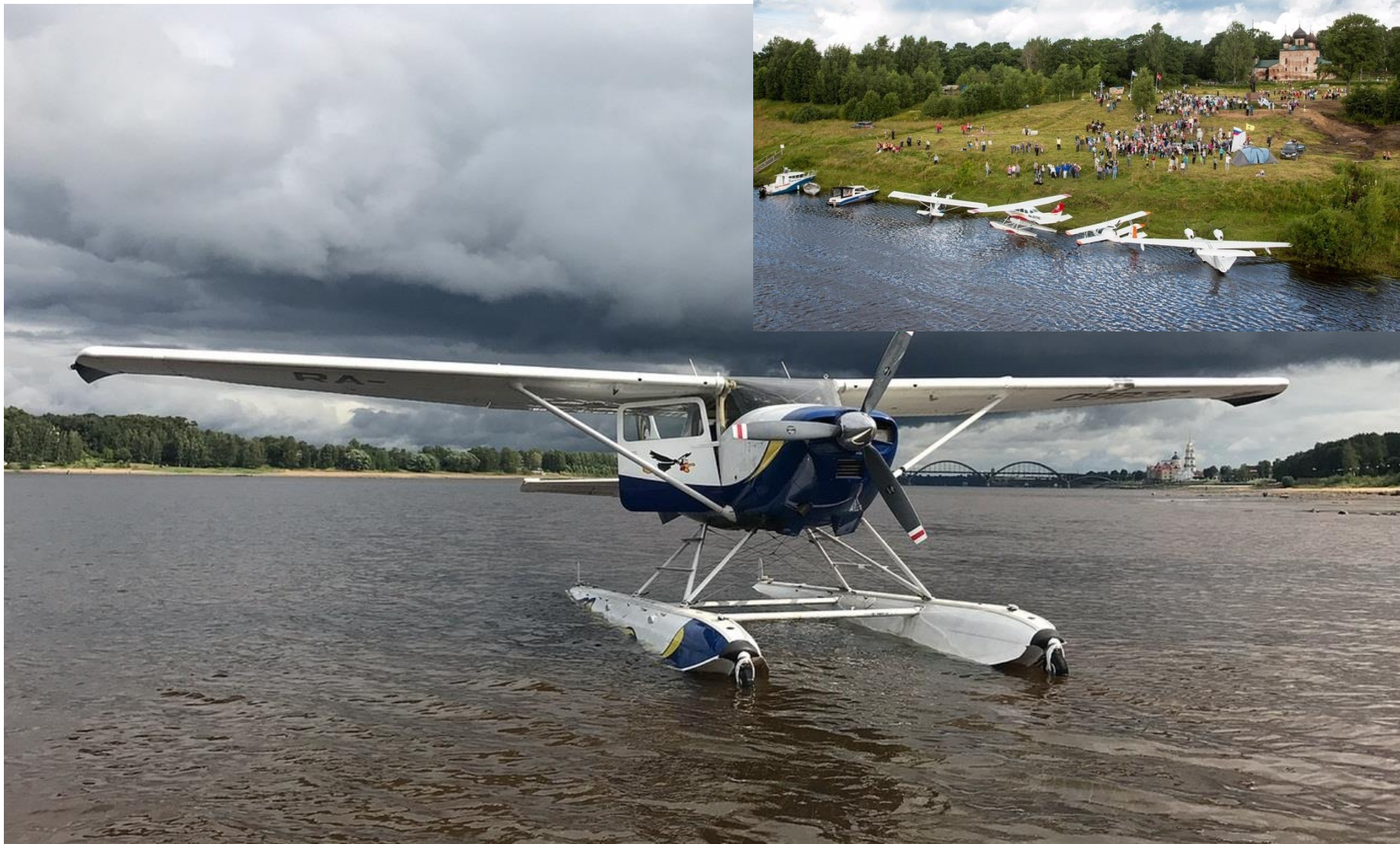
Ушаковский фестиваль под Рыбинском, 2017